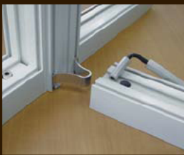
Сборка посредством скоб и эксцентриков